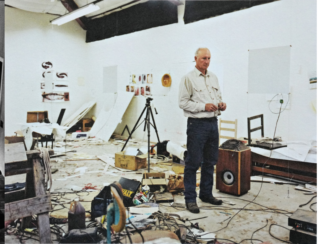
Bruce Nauman, in his studio New Mexico, 2009