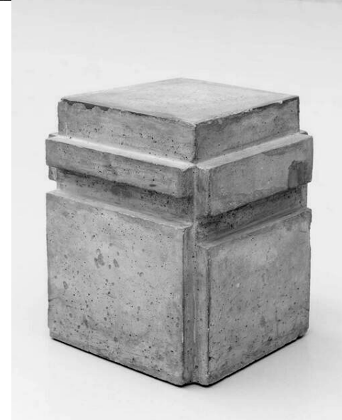
A cast of the space under my chair, 1965-1968