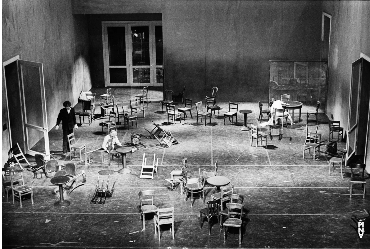
Pina Bausch, Cafe Müller , 1978.